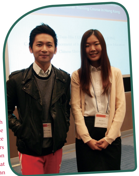
The 19th Global Chinese Conference of Computers in Education (GCCCE) at Taipei, Taiwan